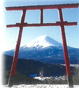
遥拝所(天空の鳥居)

富士山の大噴火を鎮めるため 865年に神社が建立されました。 安産・子授かり・縁結びの神として 崇拝されています。 境内に立つ樹齢1200年の杉の巨木、 神社の裏山にある遥拝所、そして 母の白滝はパワースポットとして 人気があります。